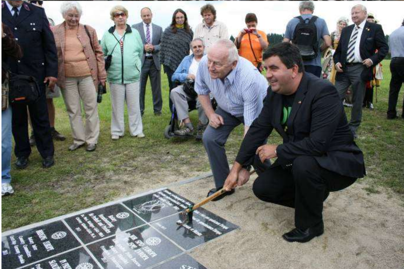
Novými účastníky Cesty se stali: město Kravaře, občanské sdružení Stránské, Střední pedagogická a Střední zdravotnická škola sv. Anežky České z Oder, Šustkovi z Dobešova, hasiči – SDH Výškovice a jejich partneři FF Boxdorf a pět desek položili zástupci klubů Rotary z Distriktu 2013